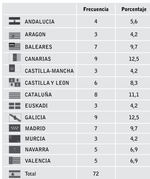
Tabla 2. Distribución de encuestados por comunidades

En la Figura 1 se observa los porcentajes generales de respuestas correctas e incorrectas a las preguntas de conocimiento. A excepción de la pregunta 1, que respondió correctamente el 67% de los encuestados, y la 5 con el 50 %, el resto de las preguntas no alcanza el 50% de respuestas correctas.