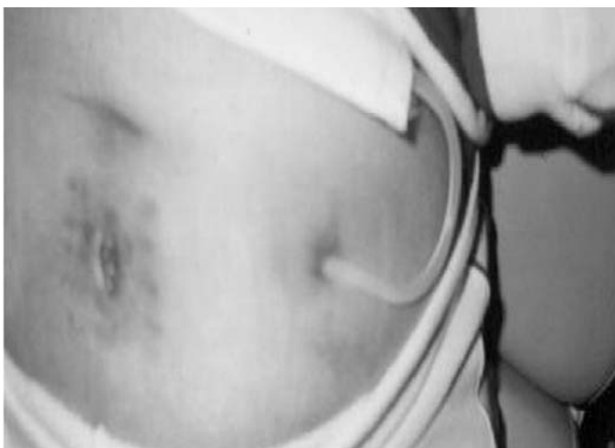
Figura 5. Evolución a los 6 días.