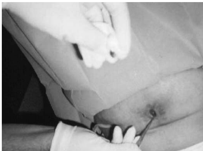
Figura 1. Desbridamiento de la herida

da quirúrgica. Se desbrida dicho absceso iniciando tratamiento con vancomicina. El 4-11-03 comenzamos con curas locales de azúcar y Vitamina C.