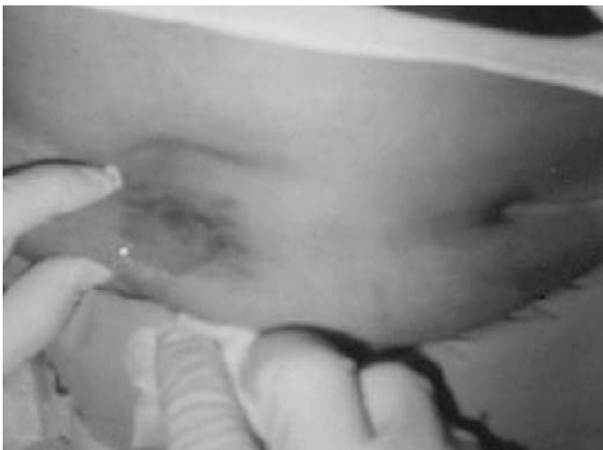
Figura 4. Colocación de vitamina C.