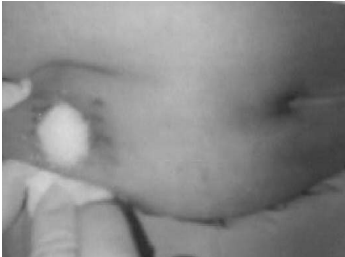
Figura 3. Colocación de azúcar.

una gasa mechada empapada en azúcar y Vitamina C desde la herida hasta la mitad del túnel.