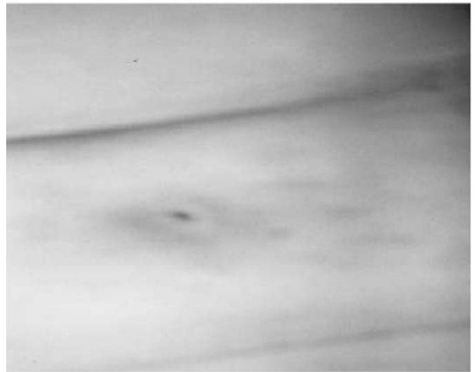
Figura 6. Herida cerrada a los 12 días de evolución.

El 4-12-03 la herida esta totalmente cerrada, pero el túnel sigue supurando por lo que se decide abrirlo quirúrgicamente, raspar el dacron y generar un nuevo orificio de salida del catéter. Se observa en el túnel el tejido esfacelado de color amarillento y la zona fistulizada con la herida cerrada.