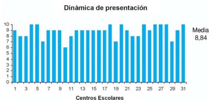
Figura 3. Evaluación de la dinámica de presentación del Programa Educativo.

La puntuación media sobre la dinámica utilizada fue 8,84 (rango de 6 y 10 puntos), la desviación estándar de 1,068 y el intervalo de confianza para la media al 95% de 8,45 y 9,23 (p<0,05) (figura 3).