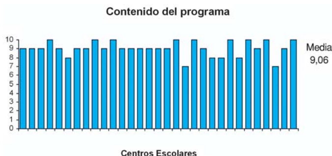
Figura 2. Evaluación del contenido del Programa Educativo.

La puntuación media sobre el contenido fue 9,06 (rango de 7 y 10 puntos), la desviación estándar de 0,772 y el intervalo de confianza para la media al 95% de 8,78 y 9,3 (p<0,05) (figura 2).