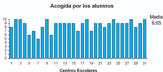
Figura 4. Evaluación de la acogida del Programa Educativo por los alumnos

La puntuación media sobre la acogida del Programa Educativo por los alumnos fue 8,65 (rango de 5 y 10 puntos), la desviación estándar de 1,226 y el intervalo de confianza para la media al 95% de 8,20 y 9,09 (p<0,05) (figura 4). En la figura 5, se recogieron los datos sobre los porcentajes de negativa familiar a la donación de órganos a nivel nacional, publicados por la Organización Nacional de Trasplante (ONT)4 y los porcentajes de negativa familiar que se produjeron en el hospital de referencia5 que atiende las necesidades sanitarias de una parte importante de la población y por lo tanto, de los alumnos y familiares de los centros escolares que han participado en el Programa Educativo.