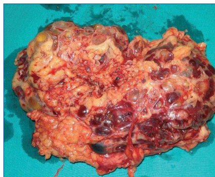
Figura 2. Pieza quirúrgica: riñón derecho poliquistico 20 x 14 cm, de 4 kg, con múltiples quistes complicados con material purulento.

En resumen, presentamos el caso de una paciente con pielonefritis enfisematosa con poliquistosis hepatorenal, en la que destaca, en primer lugar, la tórpida evolución de una infección renal inusual y severa y, en segundo, la necesidad de nefrectomía radical como tratamiento definitivo.