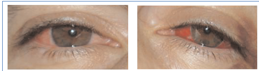
Figure 1. Subconjunctival bleeding due to diffuse episcleritis.

Here we present a case of a 44 year old male patient complained of asthenia for one month. Two weeks before he developed bilateral subconjunctival hemorrhage without photophobia or ocular pain. The patient denied epistaxis, hemoptysis, abdominal pain, arthralgias or myalgias. On examination he had subconjunctival bleeding due to bilateral diffuse episcleritis (Figure 1). There were no cardiopulmonary auscultatory findings, no purpura and no signs of arthritis. The patient past medical history was remarkable for chronic sinusitis with frequent episodes of epistaxis. The blood panel showed severe azotemia (serum creatinine 11,2 mg/dl, BUN 100 mg/dl), normocytic normochromic anaemia (Hb 11,3 g/dl; Ht 33,3%), C-reactive protein 16,9 mg/L (0-10 mg/L), active urinary sediment (30 red blood cells per high-