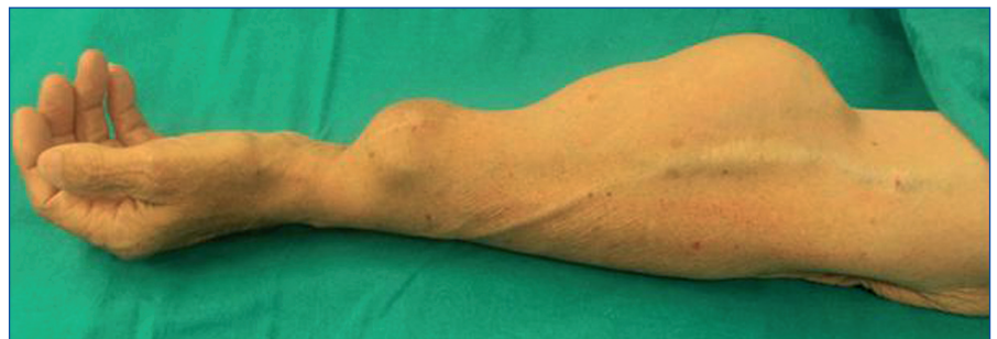
Figura 1. Exploración física Aspecto clínico de la tumoración.

El tratamiento de los aneurismas arteriales verdaderos debe realizarse de forma preferente por el riesgo de complicaciones locales y sistémicas que conllevan, pueden embolizar, trombosarse, erosionar la piel y causar infección, sangrado, o comprimir estructuras nerviosas adyacentes produciendo parestesia, dolor o alteraciones de la movilidad 6 . El tratamiento de elección es la resección del aneurisma con reconstrucción arterial 4 para garantizar una perfusión adecuada de la extremidad después