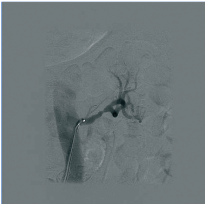
Figura 3. Espasmo de la arteria renal izquierda tras procedimiento.

ficación significativa de la frecuencia cardíaca. No se han producido complicaciones inmediatas al procedimiento ni requerido tras éste ningún ingreso hospitalario.