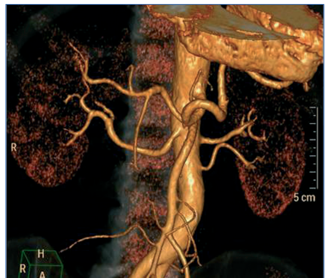
Figura 1. Angio-TAC antes de la DNSR. Presencia de polar inferior en riñón izquierdo.

La evolución posterior de las cifras de PA tras la técnica se describe en la tabla 1. Como se puede apreciar, a los tres meses del tratamiento las PA sistólica y diastólica medias de 24 horas han descendido 22 mmHg, sin modi-