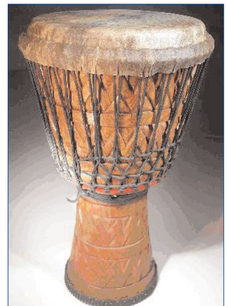
Figura 1. Tambor africano dyembe .

Se han publicado numerosos casos relacionados con actividades físicas en miembros inferiores, y solo 3 casos en miembros superiores: en 1974 se produjo en EE. UU. el caso de un hombre joven que presentó pigmenturia positiva para mioglobina y hemoglobina tras sesión de percusión; en 2006, en Uruguay, se describió el caso de 26 individuos tras tocar tambores en una fiesta nacional 7 ; y en 2011, un hombre caucásico presentó hemoglobinuria tras tocar tambores, lo que introdujo el término «hemoglobinuria de la percusión» 8 .