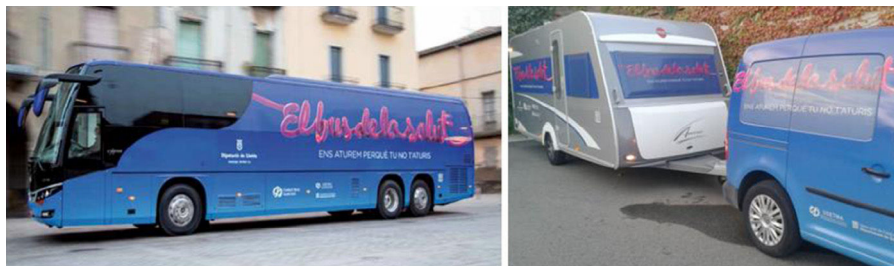
Figura 1 - Diseño exterior de la unidad móvil (autobús y caravana).