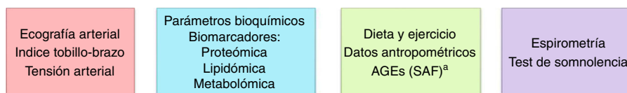
Figura 2 - Pruebas diagnósticas en la unidad móvil.

a La prueba diagnóstica utilizada para medir los AGE es la autofluorescencia de la piel.