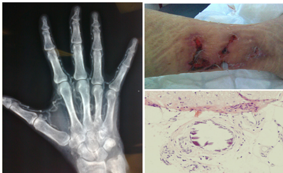
Figura 2 – Lesión cutánea en miembro inferior secundaria a calcifilaxis (arriba derecha). Lesiones histológicas en el tejido celular subcutáneo con áreas de calcificación, algunas de ellas perivasculares, compatibles con calcifilaxis (abajo derecha). Radiografía de mano izquierda en la que se observan calcificaciones vasculares (izquierda).