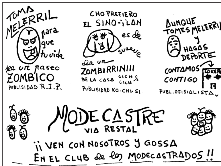
Sátira publicitaria. Ambiente (Murcia) 1985, n.º 19, p. 19.