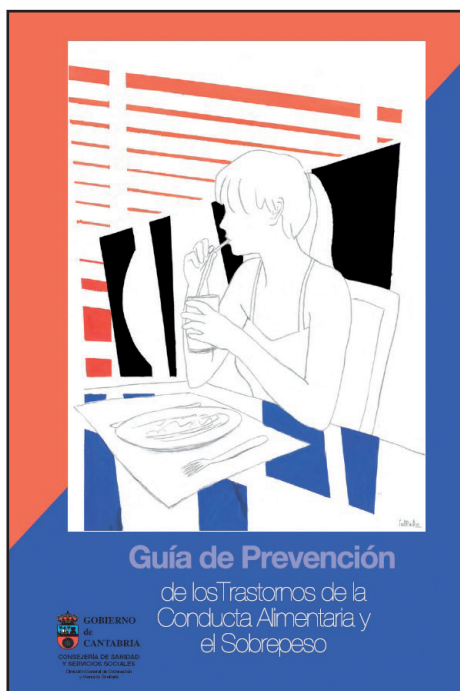
Figura 2. Guía de prevención de los TCA y el sobrepeso.

rico del modelo cognitivo social, en el enfoque educacional denominado alfabetización en medios de comunicación y en la teoría de la disonancia cognitiva (54). Obtuvo mayores reducciones en las chicas del grupo de intervención en la internalización del ideal de belleza, las actitudes alimentarias alteradas y la preocupación por el peso al año de seguimiento (54).