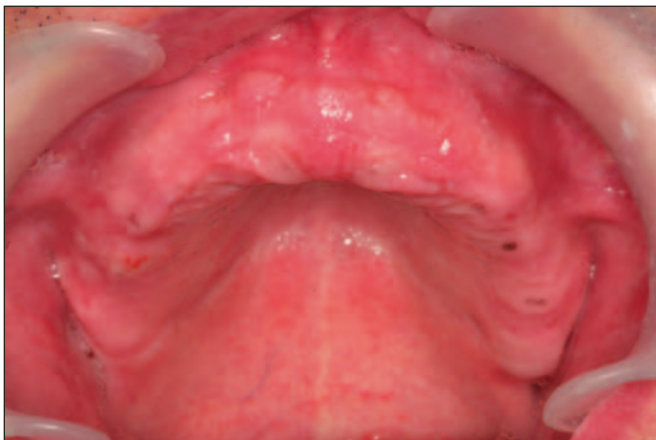
Fig. 5. Paciente geriátrico edéntulo total maxilar.

La longitud de los implantes puede constituir un factor importante en el éxito del tratamiento ya que se ha demostrado una relación directa entre una mayor longitud y unas mejores expectativas de éxito a largo plazo en los pacientes edéntulos completos. La longitud del implante permite una inserción estable y, en este sentido, asegurar al máximo la oseointegración ya que la superficie de contacto hueso/implante