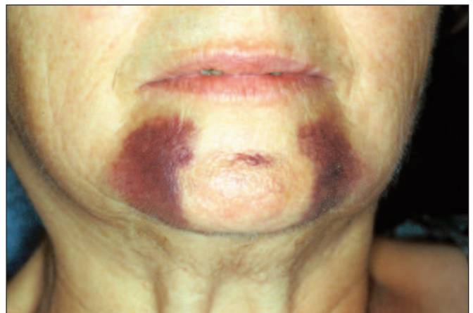
Fig. 1. Hematoma en localización de implantes para sobredentadura mandibular.

El tratamiento con implantes puede ser mantenido con éxito por los pacientes mayores a lo largo de su vida (8). En este sentido, un estudio canadiense compara los resultados clínicos de 39 pacientes mayores de 60 años (edad media de 66 años) con 190 implantes para soportar 45 prótesis y de 43 adultos jóvenes (edad media de 41 años) con 184 implantes para soportar 45 prótesis (8). Los pacientes fueron monitorizados durante un periodo de 4 a 16 años después de la carga funcional. Las indicaciones prostodóncicas más frecuentes fueron la rehabilitación fija (51%) y las sobredentaduras (27%). El éxito acumulativo mostró una diferencia no significativa del 92% en el grupo mayor y del 86,5% en el grupo más joven. La mayor parte de los fracasos ocurrieron antes o durante el primer año después de la carga funcional protésica. Aunque los pacientes mayores padecían o desarrollaron trastornos médicos, la oseointegración no se alteró por su estado sistémico, lo que sugiere que el éxito del tratamiento implantológico puede no afectarse por las enfermedades comunes asociadas al envejecimiento. Este estudio canadiense no sólo confirma la hipótesis de que no hay diferencias entre los adultos mayores y jóvenes para el éxito de la oseointegración; sino que además, los resultados sugerían una tendencia de mayor éxito entre los pacientes ancianos (8).