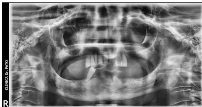
Fig. 2. Planificación de tratamiento con implantes mediante ortopantomografía.

En este sentido, los pacientes mayores, previamente a la inserción de los implantes, deben ser medicados con prevención antibiótica el mismo día de la cirugía (ej.: amoxicilina + ácido clavulánico). Si el paciente presenta ansiedad por la intervención se le puede