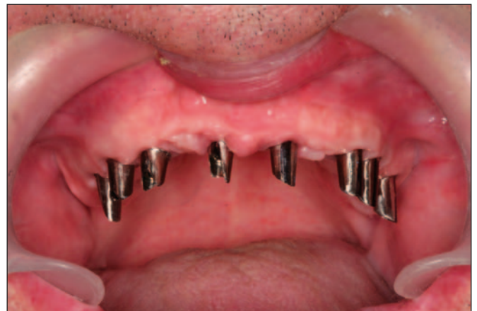
Fig. 7. Pilares mecanizados individualizados en el paciente geriátrico edéntulo total maxilar.