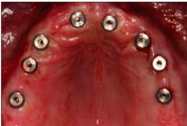
Fig. 6. Implantes insertados en el paciente geriátrico edéntulo total maxilar.