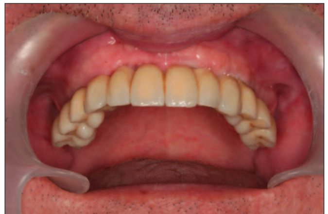
Fig. 8. Rehabilitación oral fija cementada en el paciente edéntulo maxilar.