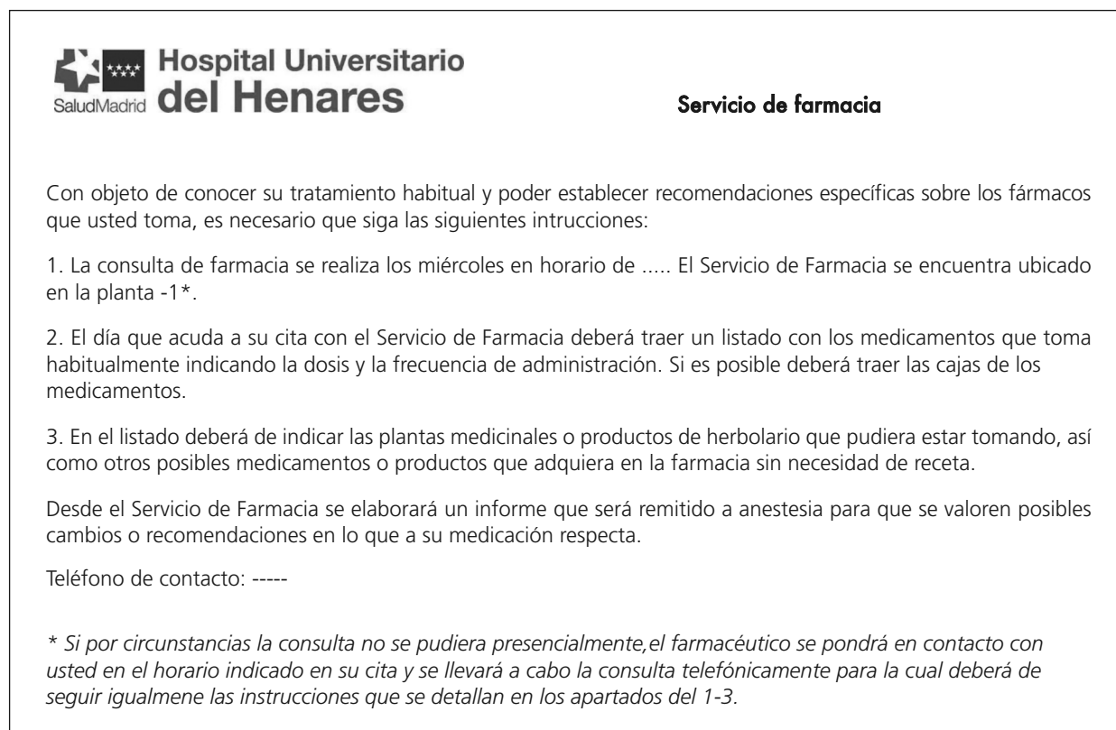
Figura 2. Instrucciones dirigidas al paciente