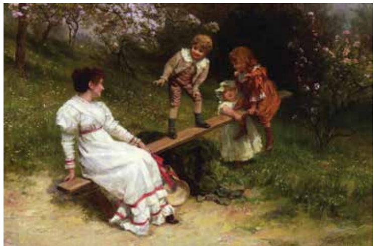
El balancín , 1898.

En este cuadro podemos comprobar cómo una disciplinada mamá, sin despeinarse en absoluto, equilibra a tres mocosos en un balancín. La calma de la progenitora, llena de tonos blancos, contrasta con la energía de la chavalada. Hay que destacar, asimismo, la excelente plasmación de la primavera circundante al columpio de marras.