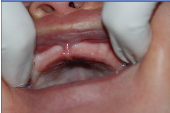
Figura 4. Se visualiza la ausencia de recidiva de la tumoración tras 4 semanas

En la mayoría de casos, el reconocimiento de la lesión se realiza después del nacimiento, en otras