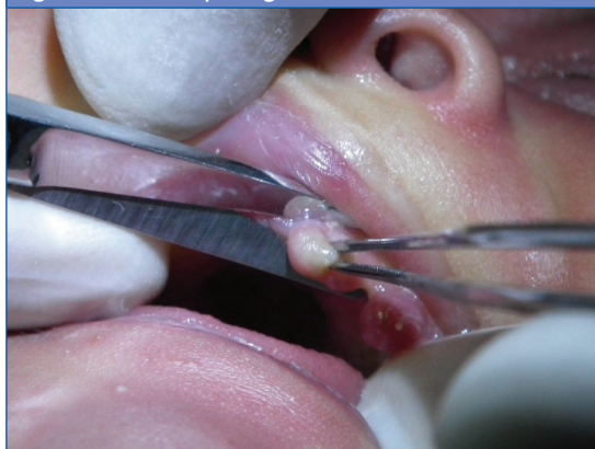
Figura 2. Técnica quirúrgica a los 34 días de edad

En los cortes histológicos del material obtenido se observó (Fig. 3) el epitelio superficial intacto con