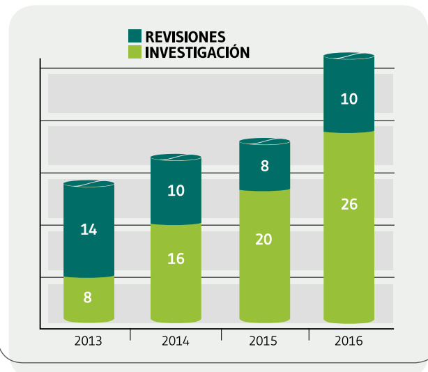
Figura 3. Evolución de la cantidad de artículos de investigación publicados en la Revista Española de Nutrición Humana y Dietética entre 2013 y 2016.

científico, lo cual permite cumplir con uno de los requisitos básicos de las actuales bases de datos documentales. Las/ los autoras/es que han decidido publicar en RENHyD son el cuerpo humano y académico que ha permitido tal logro. Muchas gracias, sin vosotras/os, la revista no podría existir.