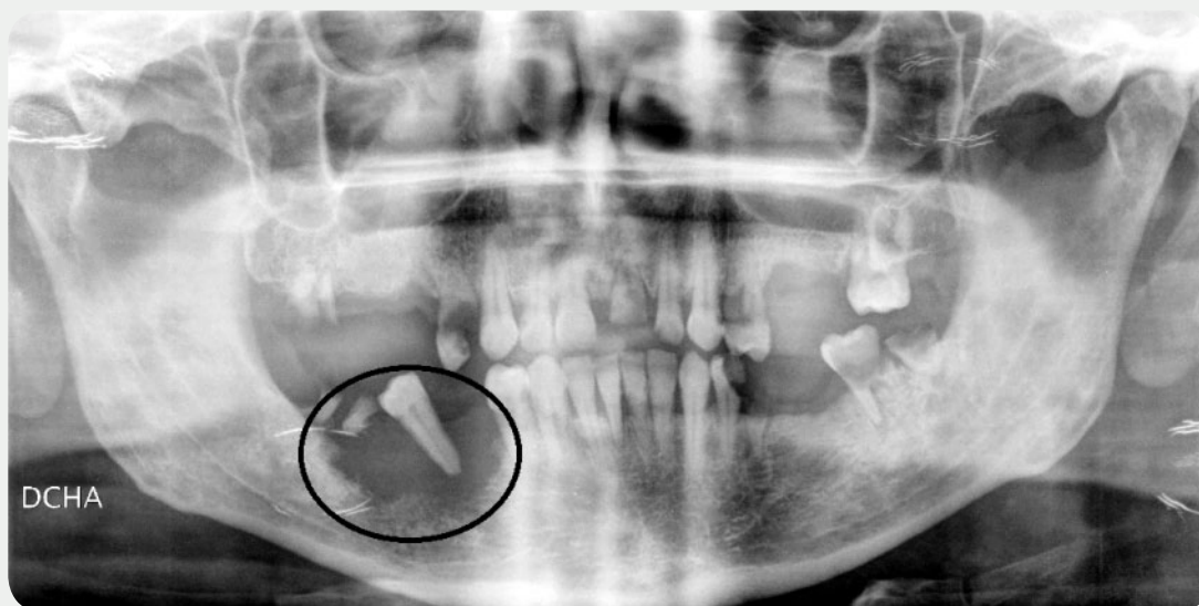
Figura 1. Ortopantomografía con lesión neoplásica en mandíbula derecha.

Posteriormente el paciente es sometido a tratamiento quirúrgico en un centro oncológico, donde se le practica una