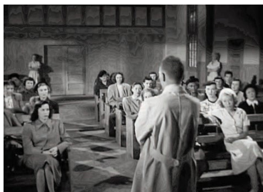
Foto 4. Familiares de los pacientes recibiendo recomendaciones por parte del Dr. Brock.

En el filme se aprecia como los familiares de los pacientes, especialmente las esposas, se comprometen en la discapacidad que poseen los pacientes parapléjicos, acudiendo a las charlas informativas por parte del Dr. Brock (Foto 4). Las preguntas formuladas por los familiares se centran en una posible cura, edad, los hijos, el comportamiento del paciente. La edad es una interrogante frecuente en la paraplejía puesto que en la película (y en la vida real) la mayoría de los pacientes son jóvenes adultos. «Mi hijo tiene 19 años». le dice una madre preocupada al Dr. Brock y él responde: «Lo sé, pero si se cuida puede llegar a los 90». Otra pregunta formulada por una esposa es: «¿Es posible tener otro hijo?» respondiendo el doctor: «Es difícil de decir, en muchos casos es posible». Otra interrogante es: «Quiero seguir con mi marido, pero ha cambiado tanto, es otro». El Dr. Brock responde: «No, no es otro. Es el mismo hombre, ahora con una lesión en la espina, solo que está deprimido (...) Todo es cuestión de tiempo y de paciencia».