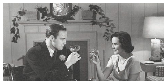
Foto 6. Ambos protagonistas inician su vida de casados brindando con esperanza por un gran futuro.