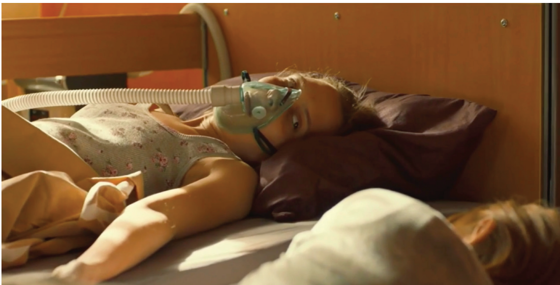
Fotograma 7. Asia necesita oxígeno todo el tiempo para poder respirar