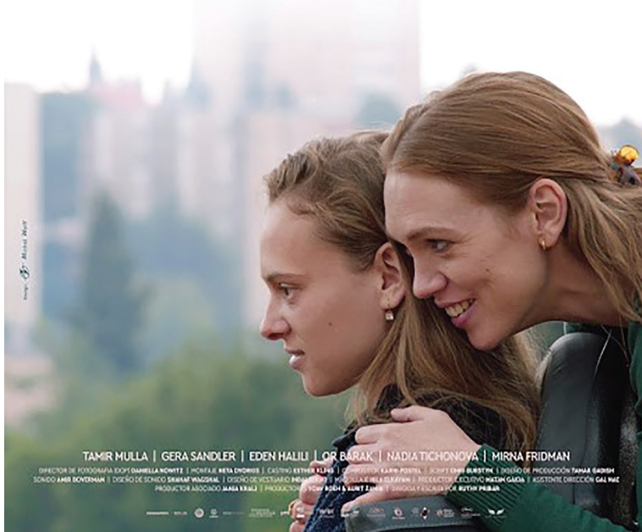
Cartel en español