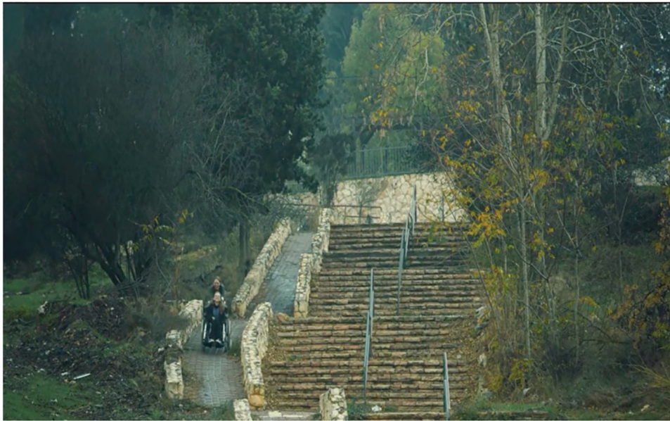
Fotograma 5. Asia pierde progresivamente su capacidad de movilización. Dificultad para subir por si sola las escaleras (A) y debe usar silla de ruedas que faciliten su desplazamiento, que es maneja por su madre (B)