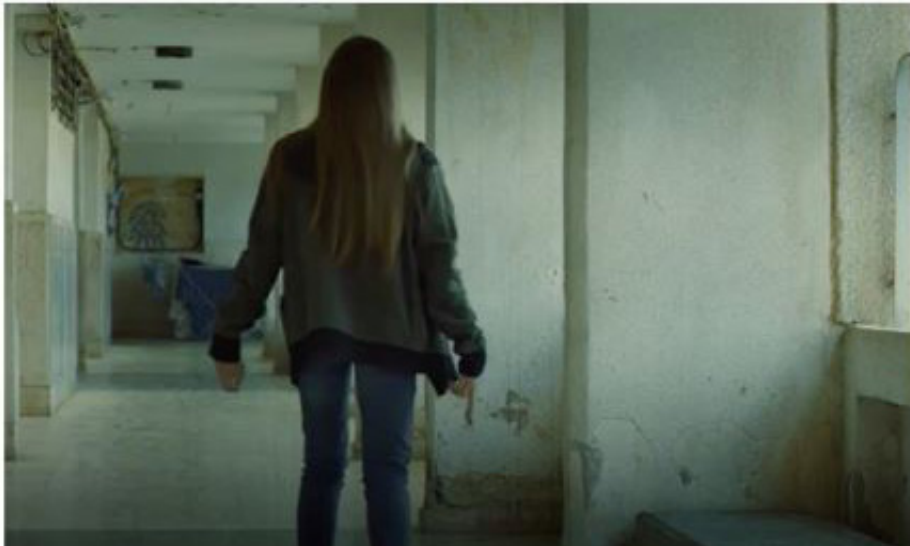
Fotograma 4. Existe deformidad en sus manos que le impiden sujetarse, además va presentando dificultad para levantarse (A) y caminar (B)