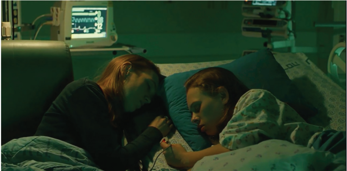
Fotograma 2. La condición de Asia va decayendo e ingresa en el hospital bajo el cuidado de su madre