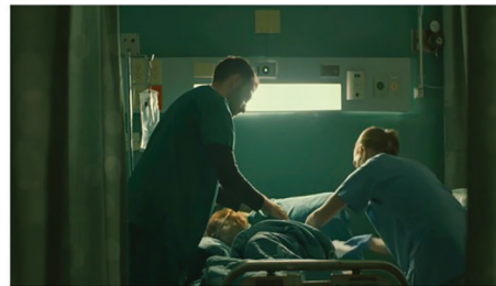
Fotograma 3. Escenas en las que se demuestran las distintas ocupaciones diarias de un profesional de enfermería en un hospital y que a la vez es madre de una persona con una enfermedad crónica