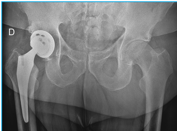
Figura 1. RX simple de caderas tras 2 años y 4 meses de la implantación de la PTC derecha sin signos de movilización.

vas (Fig. 2 A y B). En la fase ósea tardía se aprecia hipercaptación del trazador en tercio proximal de fémur derecho (Fig. 2C, flecha), correspondiéndose en las imágenes de fusión SPECT/TC (Fig. 3) con actividad osteogénica aumentada en islotes óseos (de hasta 1,8 cm) en partes blandas adyacentes al trocánter mayor. Dichos hallazgos son compatibles con osificaciones heterotópicas (OH), descartándose movilización de PTC derecha.