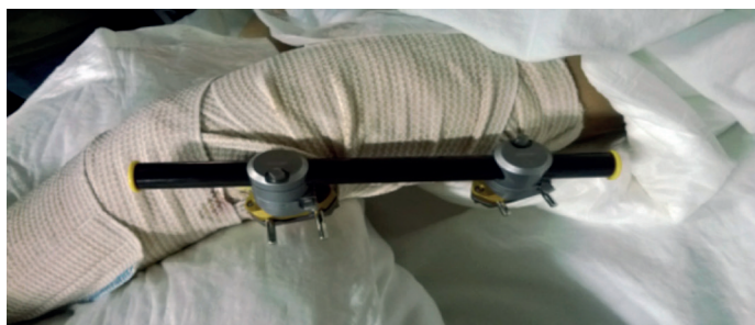
Figura 2. Fijación externa Stryker TRIAX monotubo sobre diáfisis femoral. Inmediato postoperatorio.

En quirófano y previa optimización anestésica se procede al tiempo quirúrgico que implica un desbridamiento de las partes blandas necróticas con lavado pulsátil profuso. Mediante escopia se confirma la presencia de una fractura de diáfisis femoral de trazo transverso e inestable. Se procede a reducción cerrada con control de escopia de la fractura, realizándose una técnica de fijación externa mediante implantación de un fijador externo Stryker™ TRIAX (Fijador externo de muñeca y pequeños fragmentos utilizado aquí como método de circunstancias) en configuración monoplano y monotubo. Dos pines proximales y dos pines distales y comprobación bajo escopia de la correcta colocación de los pines (Figura 2).