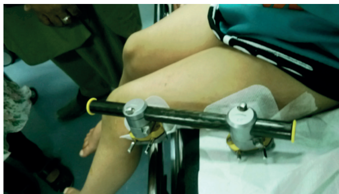
Figura 4. Curación completa de partes blandas.