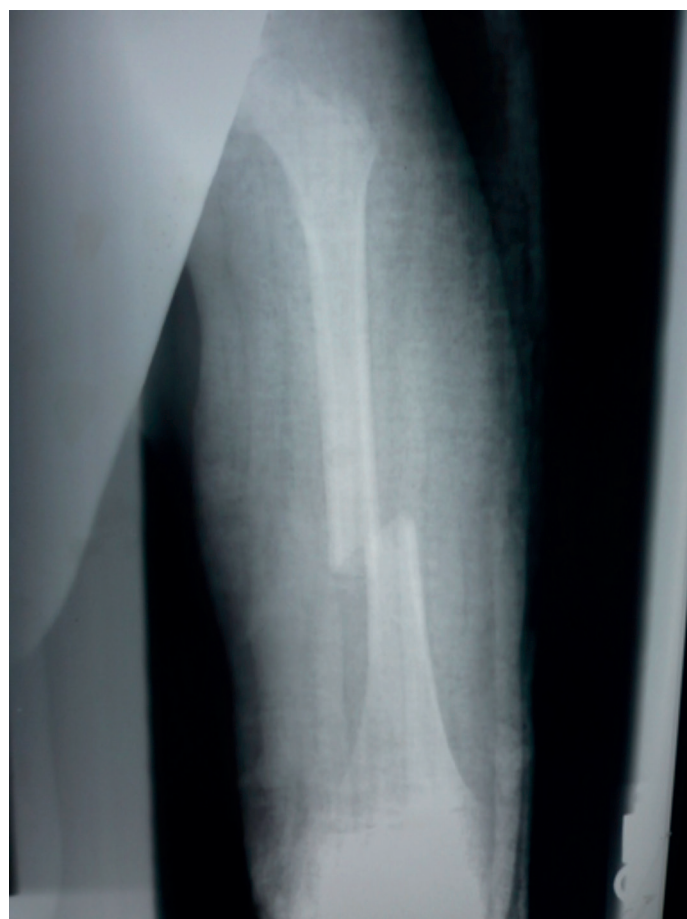
Figura 1. Inaceptable reducción inicial de fractura diafisaria de fémur.

En ausencia de varillas endomedulares elásticas tipo TENS o fijadores externos para la edad pediátrica se decide una fijación