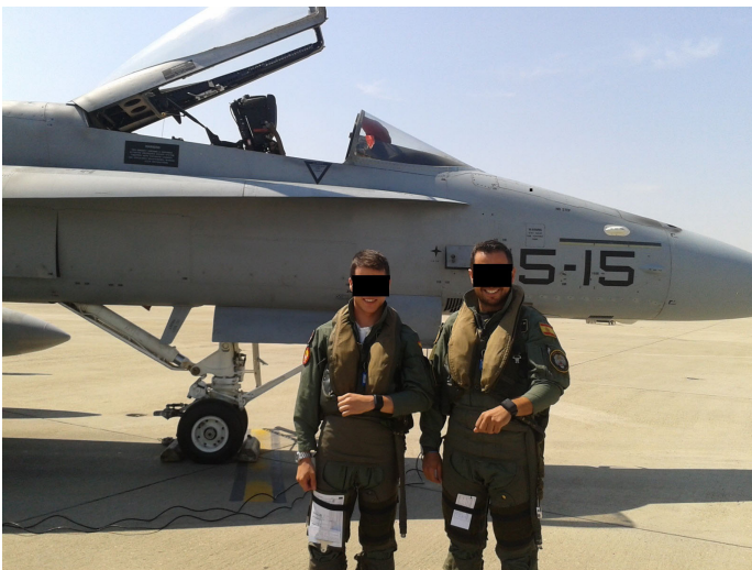
Figura 2. Disposición de los aparatos en los pilotos.

las señales físicas ambientales mediante los sentidos, activando la corteza cerebral y procesando la información recibida. En el segundo caso, una rama del sistema nervioso autónomo –en concreto el sistema simpático- activará las conductas de alarma, alerta, atención y reacción del individuo mediante hormonas, especialmente CRF, ACTH, adrenalina y noradrenalina, generando respuestas de activación fisiológica (dilatación pupilar, aumento de ritmo cardíaco y de presión sanguínea en órganos principales, sudoración, contracción muscular), activación cognitiva (aumento de reacción a estimulación sensorial, incremento de capacidad atencional, resistencia al cansancio), y emocional (subida del tono anímico, sensación de mayor energía, motivación para la acción y la toma de decisiones).