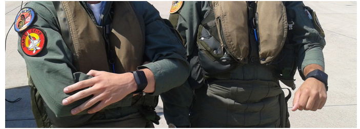
Figura 3. Detalle de dispositivos.

La teoría de Yerkes-Dodson 3 propone una relación entre el nivel de activación del sistema nervioso (arousal) y el rendimiento del individuo mediante el gráfico llamado de u invertida. De esta forma, unos niveles adecuados de activación o estrés producirán una ejecución óptima, mientras que un exceso de activación o una falta total de la misma generarán una disminución de la ejecución debido al pánico o la confusión en el primer caso o a la complacencia o excesiva relajación en el segundo. Este nivel de activación tiene una relación directa con el nivel de glucocorticoides de los cuales el cortisol es un principal representante.