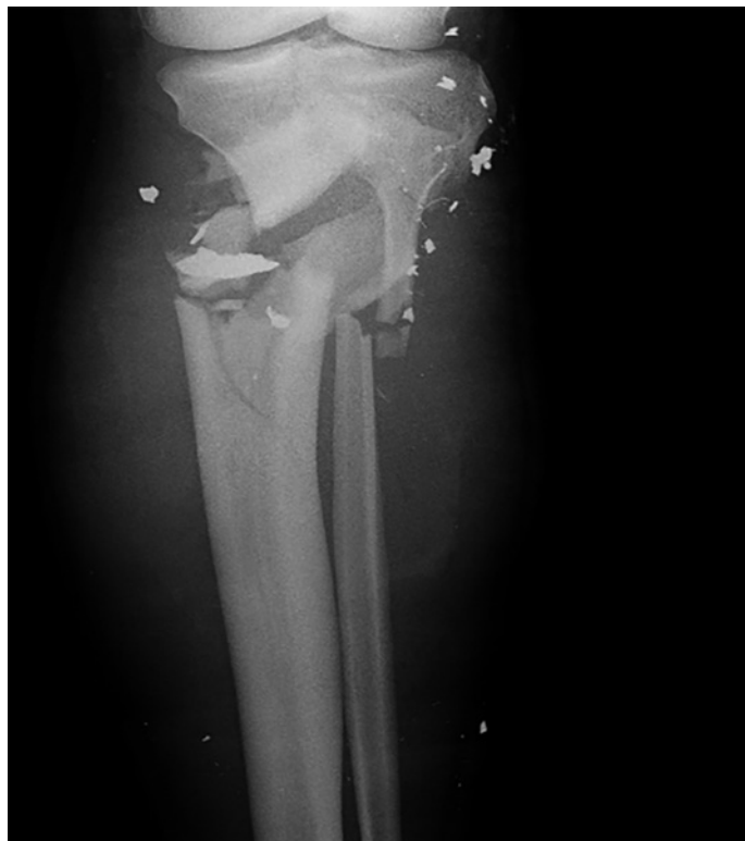
Figura 3. Fractura tibia por arma de fuego en una baja de combate atendida en el Role 2 español de Herat (Afganistán).

De forma análoga, algunos autores han estudiado la gravedad en las bajas heridas por arma de fuego (figura 3). Penn-Barwell y Sargeant analizaron 450 bajas británicas con heridas por arma de fuego entre los años 2009 y 2013. De las 450 bajas, noventa y seis (21%) resultaron fallecidas a causa de sus heridas, y 354 (79%) sobrevivieron. La mediana del NISS en las bajas que fallecieron fue de 75, mientras que la mediana del NISS entre los supervivientes fue de 12 (RIQ: 4-48) con diez de ellos con un NISS de 75, todos los cuales presentaron heridas penetrantes en la cabeza 56 . Durante la segunda intifada, el arma de fuego fue el mecanismo de lesión en el 63,5% de los militares israelíes heridos. Entre las bajas que fueron categorizadas como ISS menor (puntuación 1-8) el 56,3% fueron heridas por arma de fuego, entre las categorizadas como ISS moderado (puntuación 9-15) un 25%, y en aquellas bajas que presentaron una puntuación ISS superior a 15 el arma de fuego fue el agente lesivo en el 60% de ellas 57 .