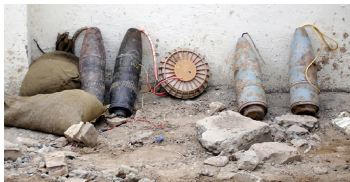
Figura 2. Improvised Explosive Device - Artefacto Explosivo Improvisado . Nota: Dominio público.

De forma análoga, algunos autores han estudiado la gravedad en las bajas heridas por arma de fuego (figura 3). Penn-Barwell y Sargeant analizaron 450 bajas británicas con heridas por arma de fuego entre los años 2009 y 2013. De las 450 bajas, noventa y seis (21%) resultaron fallecidas a causa de sus heridas, y 354 (79%) sobrevivieron. La mediana del NISS en las bajas que fallecieron fue de 75, mientras que la mediana del NISS entre los supervivientes fue de 12 (RIQ: 4-48) con diez de ellos con un NISS de 75, todos los cuales presentaron heridas penetrantes en la cabeza 56 . Durante la segunda intifada, el arma de fuego fue el mecanismo de lesión en el 63,5% de los militares israelíes heridos. Entre las bajas que fueron categorizadas como ISS menor (puntuación 1-8) el 56,3% fueron heridas por arma de fuego, entre las categorizadas como ISS moderado (puntuación 9-15) un 25%, y en aquellas bajas que presentaron una puntuación ISS superior a 15 el arma de fuego fue el agente lesivo en el 60% de ellas 57 .