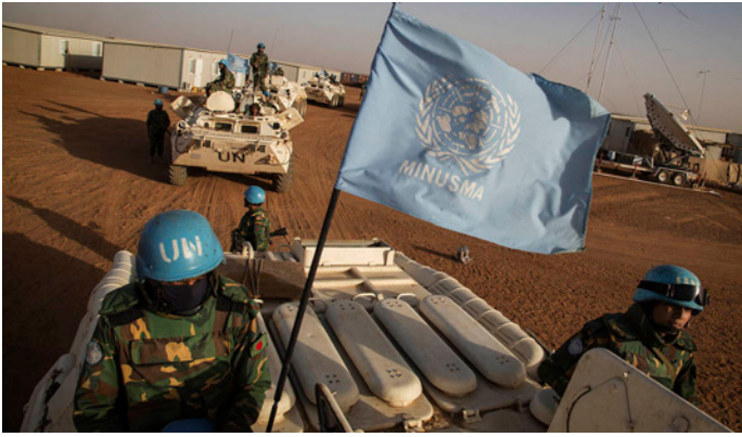
Figura 2. Soldado ONU. Descargado de: https://peacekeeping.un.org/es/military .

bles son la paciencia, el autocontrol o la flexibilidad (Harbottle, 1995). En estas operaciones los soldados con una fuerte vocación de mantenimiento de la paz y menor espíritu guerrero están más motivados y sufren menor impacto psicológico adverso (Britt, Adler y Bartone, 2000).