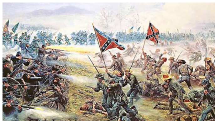
Figura 1. Batalla de Gettysburg.