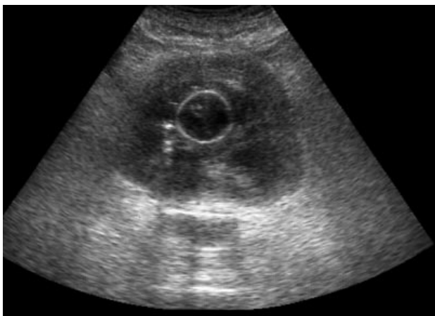
FIGURA 1. Ecografía: bloqueo vesical por coágulos.

Definida por Virchow como el depósito tisular de una sustancia amorfa que se teñía como el almidón, la amiloidosis afecta en la vía urinaria al tejido conectivo y los vasos por debajo del urotelio. Puede confundirse con un carcinoma de vejiga y causar hematuria grave, aunque raramente es un problema clínico, a juzgar por su escasa presencia en la bibliografía. La amiloidosis vesical primaria o localizada puede recurrir y necesita un seguimiento prolongado, pero tiene un curso generalmente benigno y se recomienda tratar de la forma menos invasiva posible (resección endoscópica, repetida si es necesaria, y col-