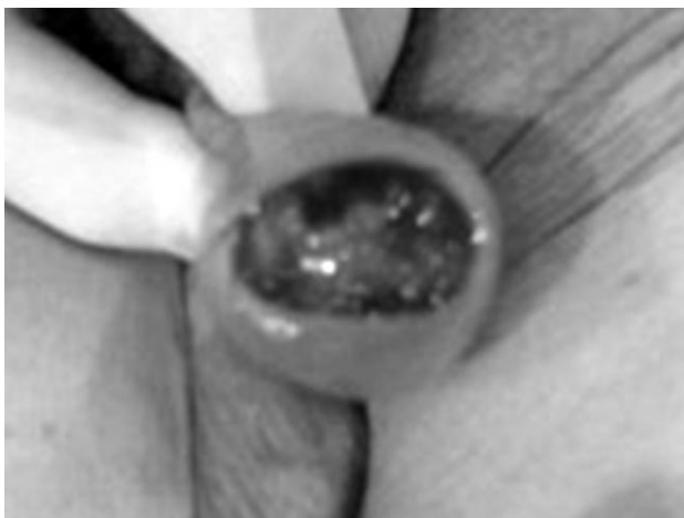
FIGURA 1. Aspecto macroscópico de la lesión.