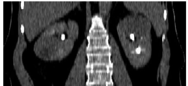
FIGURA 1. TAC renal contrastada de septiembre del 2004 donde se observan los tumores renales bilaterales.