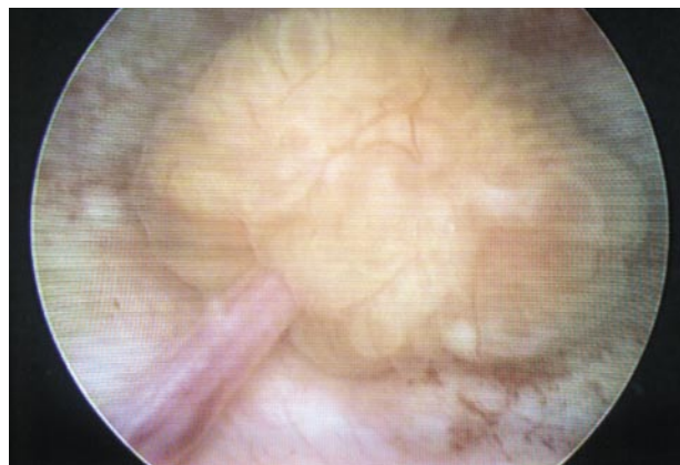
FIGURA 2. Imagen endoscópica del papiloma invertido.