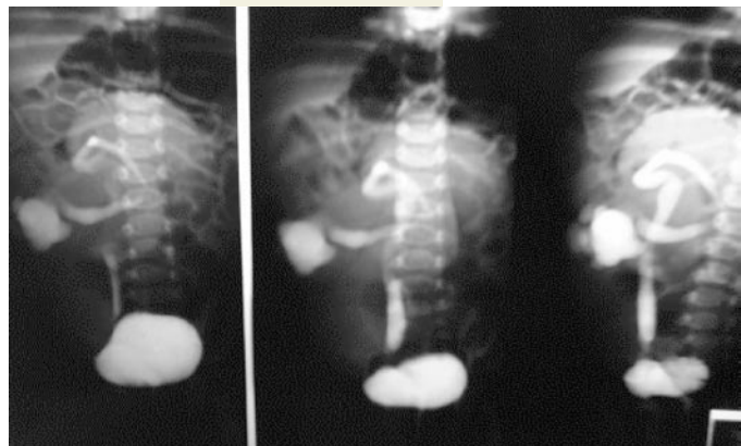
Figura 1. CUMS – Reflujo vesico-ureteral derecho polar inferior grado V. Tortuosidad del uréter por compresión extrínseca del uréter superior.

P aciente del sexo femenino, referenciado a la consulta de Urología de nuestro hospital por infecciones del tracto urinario recurrentes. En la cistouretrografía miccional seriada observamos un reflujo vesico-ureteral derecho grado V y señales indirectas de duplicidad ureteropielicas, con acentuada tortuosidad ureteral. La ecografía reno-vesical muestra ureterohidronefrosis derecha. Mediante