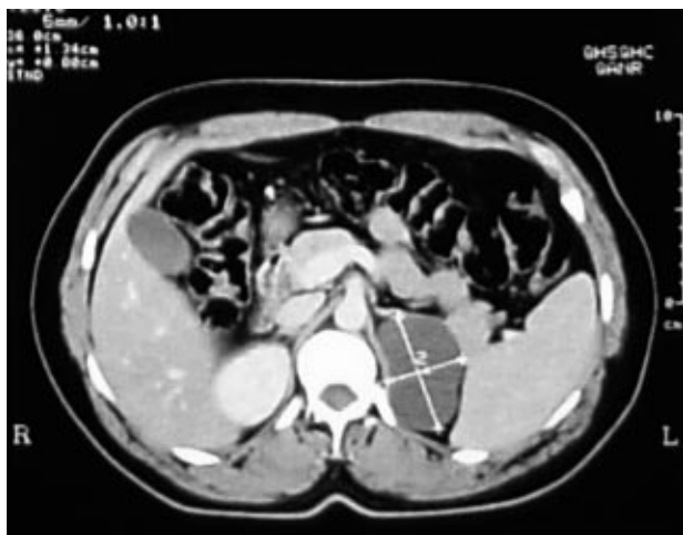
FIGURA 1. En la TAC aparece una imagen compatible con pseudoquiste adrenal izquierdo.