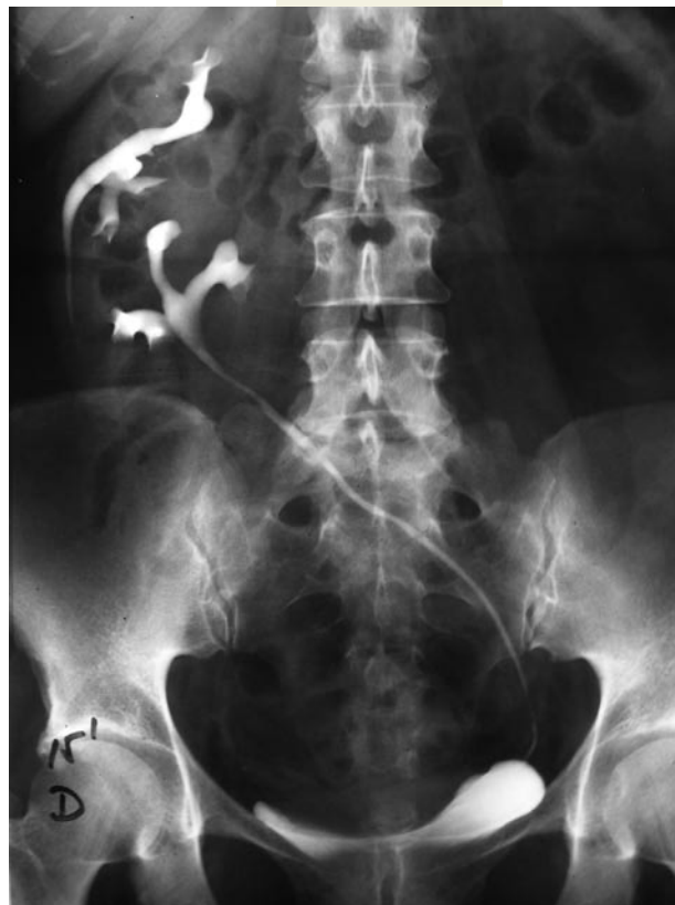
FIGURA 1. Ectopia renal cruzada.