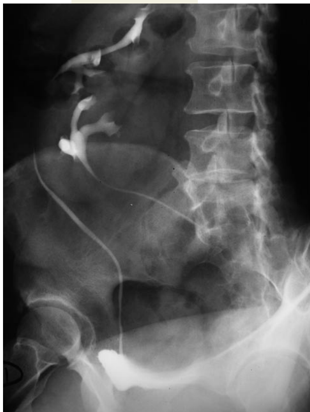
FIGURA 2. Ectopia renal cruzada.

M ujer de 30 años de edad que acude a nuestras consultas por un dolor en flanco derecho tipo cólico, practicándose entre otras pruebas de imagen una urografía intravenosa