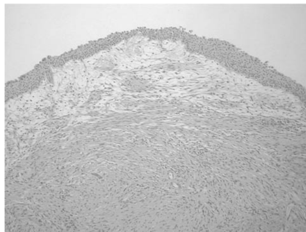
FIGURA 2. (HE 40x): Tumoración bien delimitada, no encapsulada, subyacente al urotelio normal.

Tras la resección transuretral el diagnóstico fue de leiomioma vesical (Figura 4).