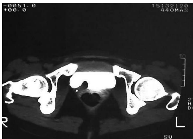
FIGURA 1. Imágen de T.A.C. en la que se aprecia una proyección endofúngica vesical.

La mayoría de los tumores vesicales derivan del urotelio. Los tumores mesenquimales son entidades raras y comprenden menos del 1% de las neoplasias vesicales, del cual los síntomas y tratamiento dependen de la localización y tamaño de la lesión. De entre ellos, el leiomioma es el más frecuente, comportando un 35% de los casos reportados, y compete con más frecuencia en mujeres jóvenes.