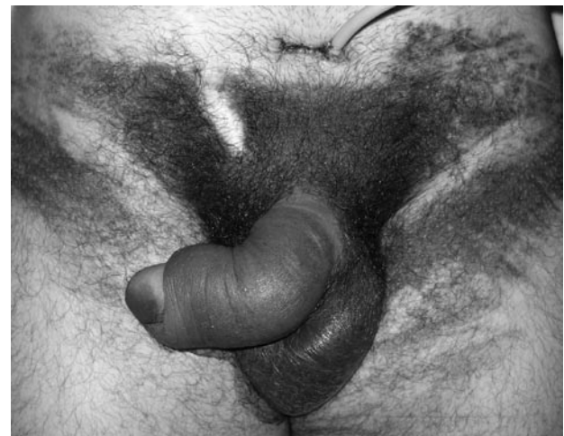
FIGURA 1. Hematoma en "alas de mariposa".

Se decide realizar una cistouretrografía retrógrada donde se evidencia fuga de contraste a nivel de uretra pén-