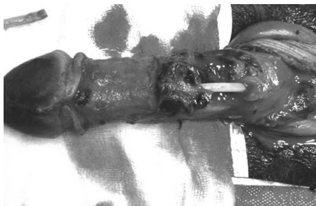
FIGURA 2. Disrupción uretral y rotura de túnica albugínea de ambos cuerpos cavernosos.

A dos meses de la cirugía, el paciente se encuentra orinando normalmente, con erecciones conservadas y sin presencia de deformidades ni curvaturas a nivel peneano.