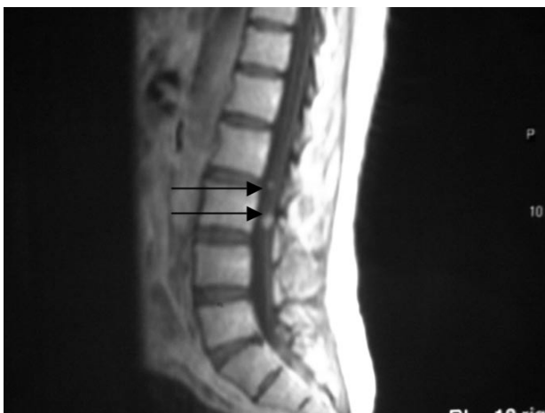
FIGURA 2. RMN. Corte sagital en el que se aprecian lesiones intradurales a nivel L2-L3.

La distribución topográfica de las metástasis refleja la irrigación sanguínea cerebral. Así las células anidan en la zona de unión de la sustancia blanca con la gris, irrigada por arterias superficiales distales (13). A pesar de que el cerebro es asiento del 80% de metástasis, no hay que olvidar que el 15% restante asentarán en cerebelo y el otro 5% en medula espinal (1). Curiosamente los tumores pelvianos, de útero o próstata tienen predilección por la fosa posterior hasta en un 50% de los casos, situación que tan solo se produce en el 10% del resto de tumores (1).