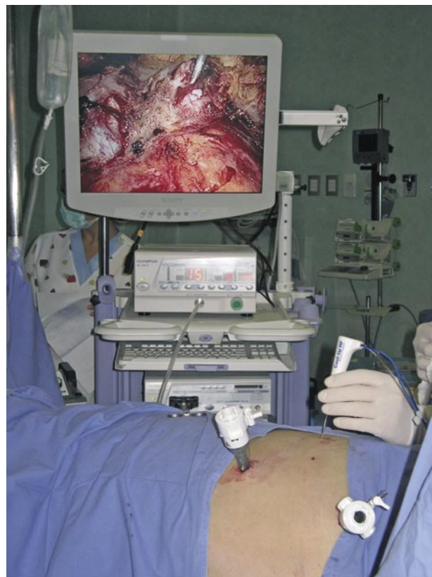
FIGURAS 2 y 3. Ablación por radiofrecuencia de tumor renal asistida por laparoscopia.

En 1990, McGahan y cols. (4) and Rossi y cols. (5), fueron los primeros en reportar el uso de RFA para el manejo de neoplasias hepáticas en modelos animales. Desde entonces osteomas osteoides y pequeños tumores hepáticos primarios y secundarios han sido tratados exitosamente con RFA. Básicamente los parámetros de RFA son similares para el hígado y riñón (6), La RFA puede ser utilizada por tecnología mono o bipolar, siendo la técnica monopolar más comúnmente usada. Cuando la técnica monopolar es realizada, la placa es puesta en el muslo del paciente. La placa actúa como un gran electrodo dispersivo que