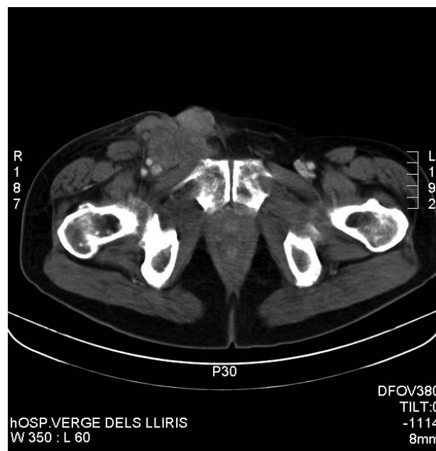
FIGURA 1. Masa de contorno irregular en conducto inguinal derecho con infiltración de musculatura profunda.

No se conoce el origen de este tipo de tumores (7), pero se especula con la posibilidad del papel de una degeneración de un leiomioma previo, originado a partir de estructuras funiculares de músculo liso, que puede localizarse en las fibras musculares cremastéricas, en el deferente, en los vasos funiculares, incluso en restos vestigiales de músculos de la pared escrotal, de las fibras conjuntivas del conducto peritoneovaginal o de restos mesoblásticos atrapados en el cordón funicular, dado que en esta compleja región anatómica pueden encontrarse restos epiteliales, mesoteliales y mesenquimales (5). La estimulación hormonal ha sido descrita en la carcinogénesis del leiomiomasarcoma (7).