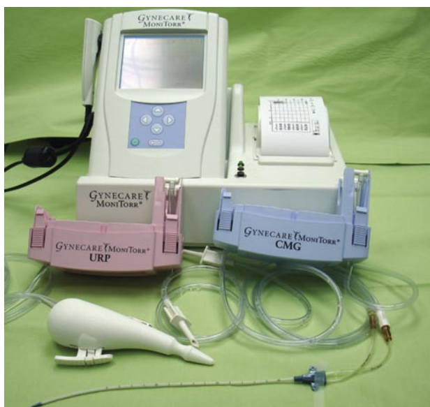
FIGURA 1. Aparato de Urodinamia Monocanal, compuesto por un microprocesador y dos dispositivos desechables (para medición de retro-resistencia uretral y el otro para el cistometrograma).

monocanal demostró: 32 normal, 2 tipo I, 5 tipo II, 5 tipo II+III, 27 DH, 3 tipo II+DH, 4 tipo II+III+DH (Tabla III).