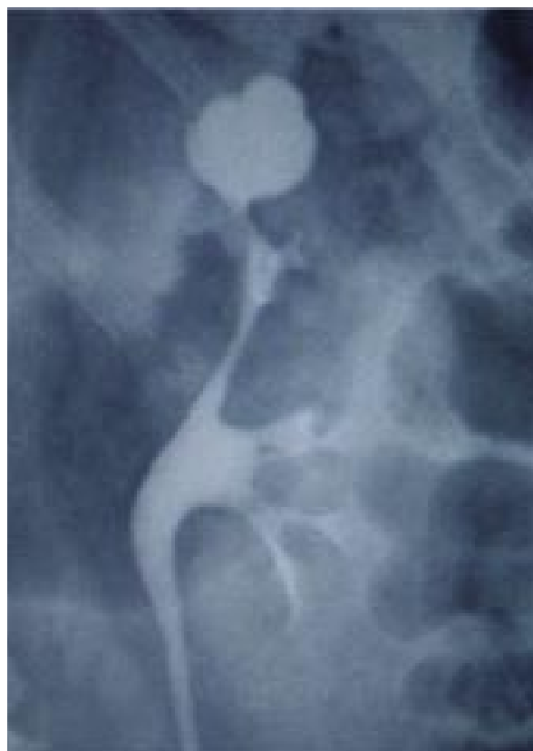
FIGURA 4. Divertículo calicial: detalle.