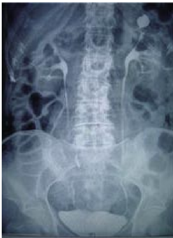
FIGURA 3. Urografía intravenosa: divertículo calicial en polo superior del riñón izquierdo.