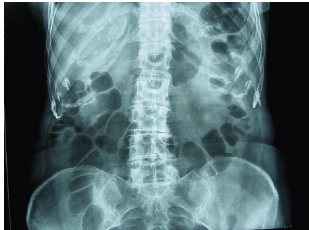
FIGURA 1. Radiografía simple de abdomen: litiasis renales izquierdas.

Se realiza una urografía intravenosa que demuestra un divertículo de unos 2 cm., de cuello estrecho, en el cáliz superior del riñón izquierdo, habitado por múltiples calculillos (Figuras 3 y 4)