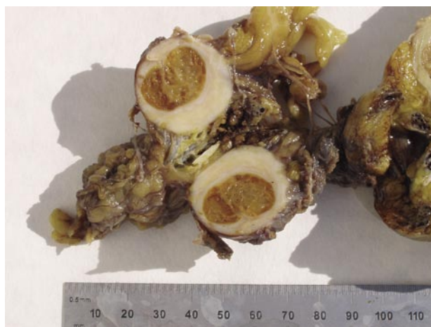
FIGURA 2. Imagen macroscópica: Detalle.