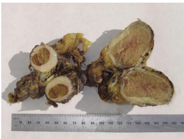
FIGURA 1. Imagen macroscópica.

Con el lema de “con una imagen basta”, presentamos un caso de pseudotumor fibroso de cordón espermático el cual, debido a sus caracte-