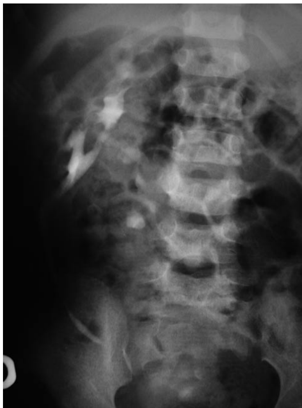
FIGURA 4. Pielografía endovenosa postoperatoria que muestra la unidad renal superior con adecuada función.

una ectopia renal cruzada con resultados adecuados en un paciente de 18 años. Pietrow et al. (6) describieron la primera resección laparoscópica mano asistida en ectopia renal cruzada con una enfermedad poliquística severa. Andersen et al. (8) descri-