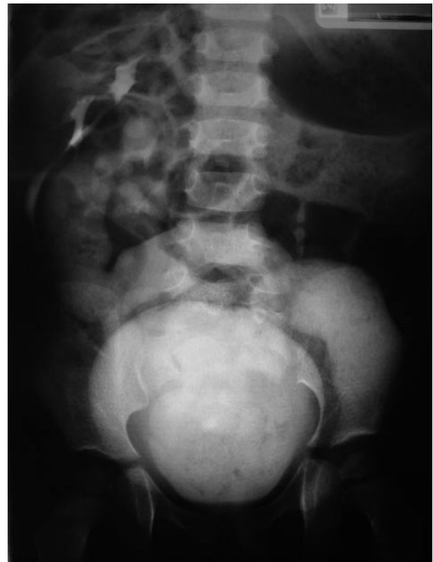
FIGURA 1. Evaluación radiológica que muestra la ectopia renal cruzada con fusión y severa hidroureteronefrosis.