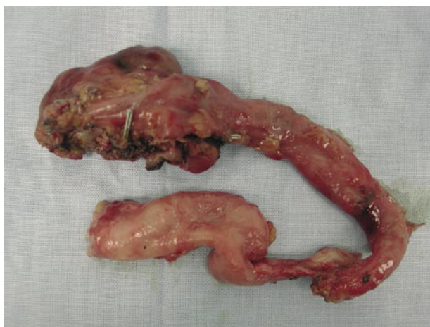
FIGURA 3. Pieza quirúrgica.

4. Resección de la unidad inferior. Se identifica el límite de resección producido por isquemia y se realiza la sección del parénquima renal mediante el bisturí harmónico. (Ethicon Endosurgery).