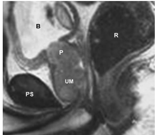
FIGURA 2. Imagen de RMN pélvica (Sagital T2) mostrando una masa homogénea en la luz de la uretra prostática.