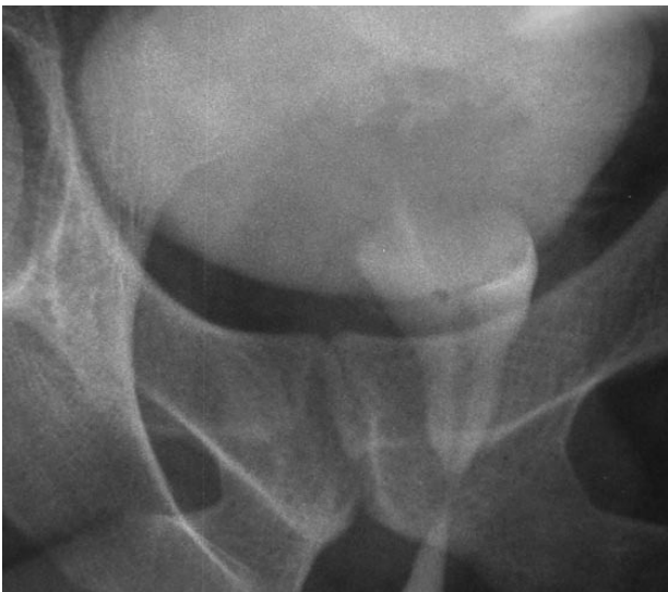
FIGURA 1. Cistouretrorristografía que muestra un defecto de repleción en la uretra prostática.

Macroscópicamente el tumor se suele presentar como una masa firme, consistente, con frecuencia sésil o pediculada, de bordes lisos y coloración rosada o (6). El examen histológico muestra células bien delimitadas, rodeadas por una cápsula fibrosa, sin estar adherida a estructuras adyacentes. Se componen de fascículos entrelazados de células fusiformes con citoplasmas eosinofílicos y núcleos de localización central, con escasa o ausente actividad mitótica. Mediante técnicas inmunohistoquímicas se demuestra reactividad difusa por la actina de músculo liso, actina músculo específica, desmina, miosina and vimentina. No expresando CD68, ni proteína S100, cromogranina o sinaptofisina (5,7).