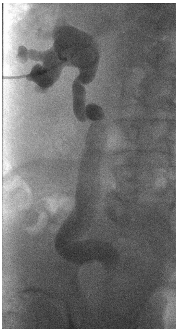
FIGURA 1. Imagen de pielografía anterógrada: vía urinaria dilatada.