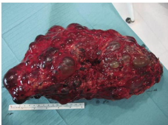
FIGURA 2. Pieza de nefrectomía de 37 cm de longitud.

P aciente de 52 años de edad de sexo masculino portador de poliquistosis renal al que se realiza nefrectomía derecha programada previa a inclusión en lista de espera de trasplante renal.