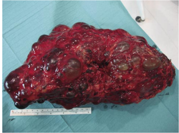
FIGURA 2. Pieza de nefrectomía de 37 cm. de longitud.

P aciente de 52 años de edad de sexo masculino portador de poliquistosis renal al que se realiza nefrectomía derecha programada previa a inclusión en lista de espera de trasplante renal.